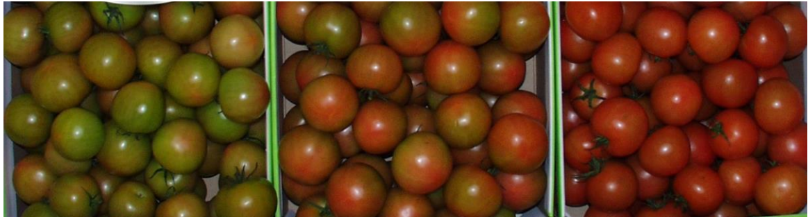
3. تحول (10-30% لون)