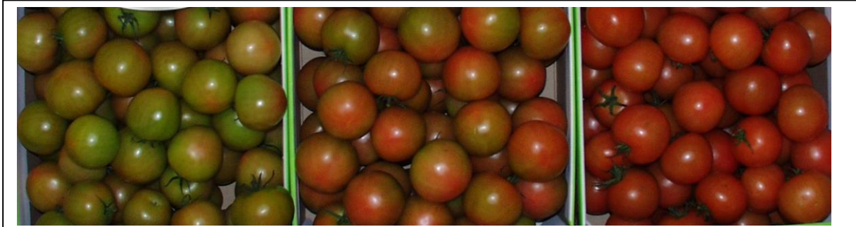
3. تحول (10-30% لون)