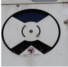
الشكل 9. مثال على فتحات الهواء الطلق للحاوية المبردة