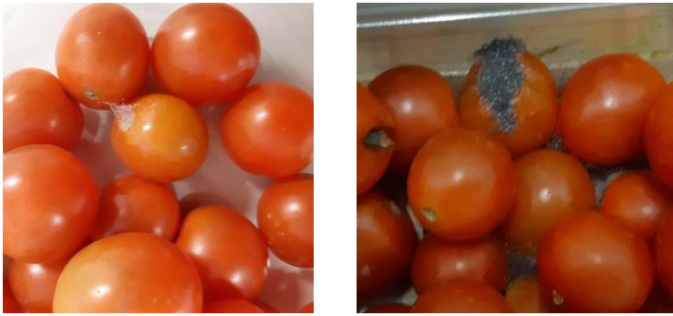
الشكل 3. لا يظهر التعامل الخاطئ الذي يؤدي إلى الإضرار بالقشرة في وقت مبكر من السلسلة دائماً لعامل القطف، إلا أن التبعات مثل التعفن الثانوي تظهر لاحقاً في السلسلة. لذلك فإن وعي عمال القطف بهذا الأمر مهم.

قد يصبح نضج الثمار وتدهورها خلال التخزين المؤقت في الحقل إذا لم يتم التعامل معها بالطريقة الصحيحة.